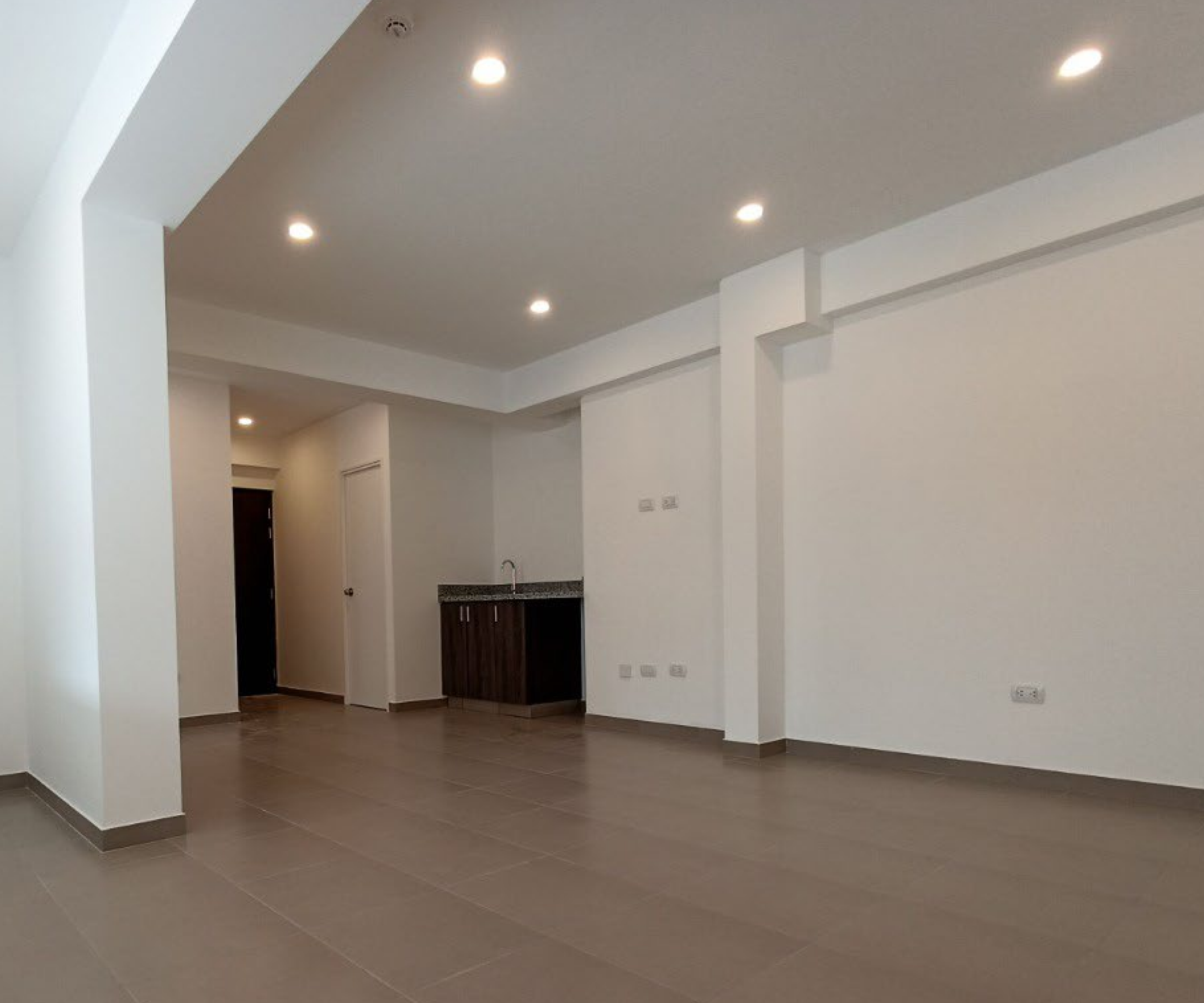
Salón de Usos Múltiples en 1° Piso