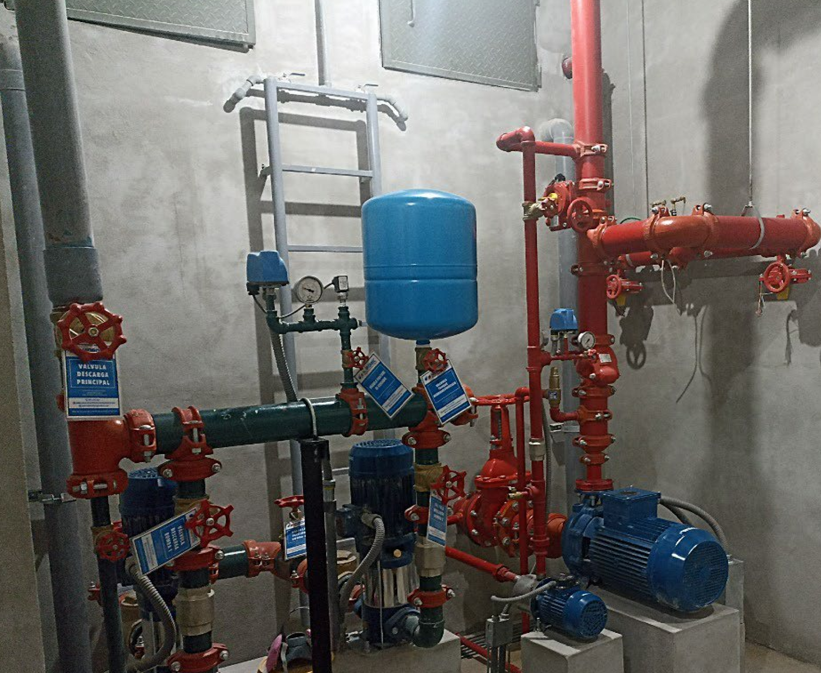
Sistema constante de presión d agua de consumo doméstico y sistema contra incendios.