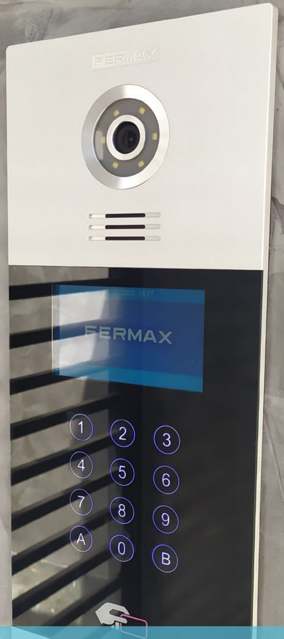
Videopuerto SMART con opción de transferencia de llamadas a smartphones